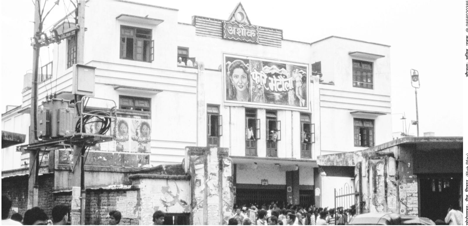
वि.सं. २०४७ सालतिरको पाटनस्थित तत्कालीन समयको एकमात्र सिनेमा हल अशोक सिनेमा हल ।