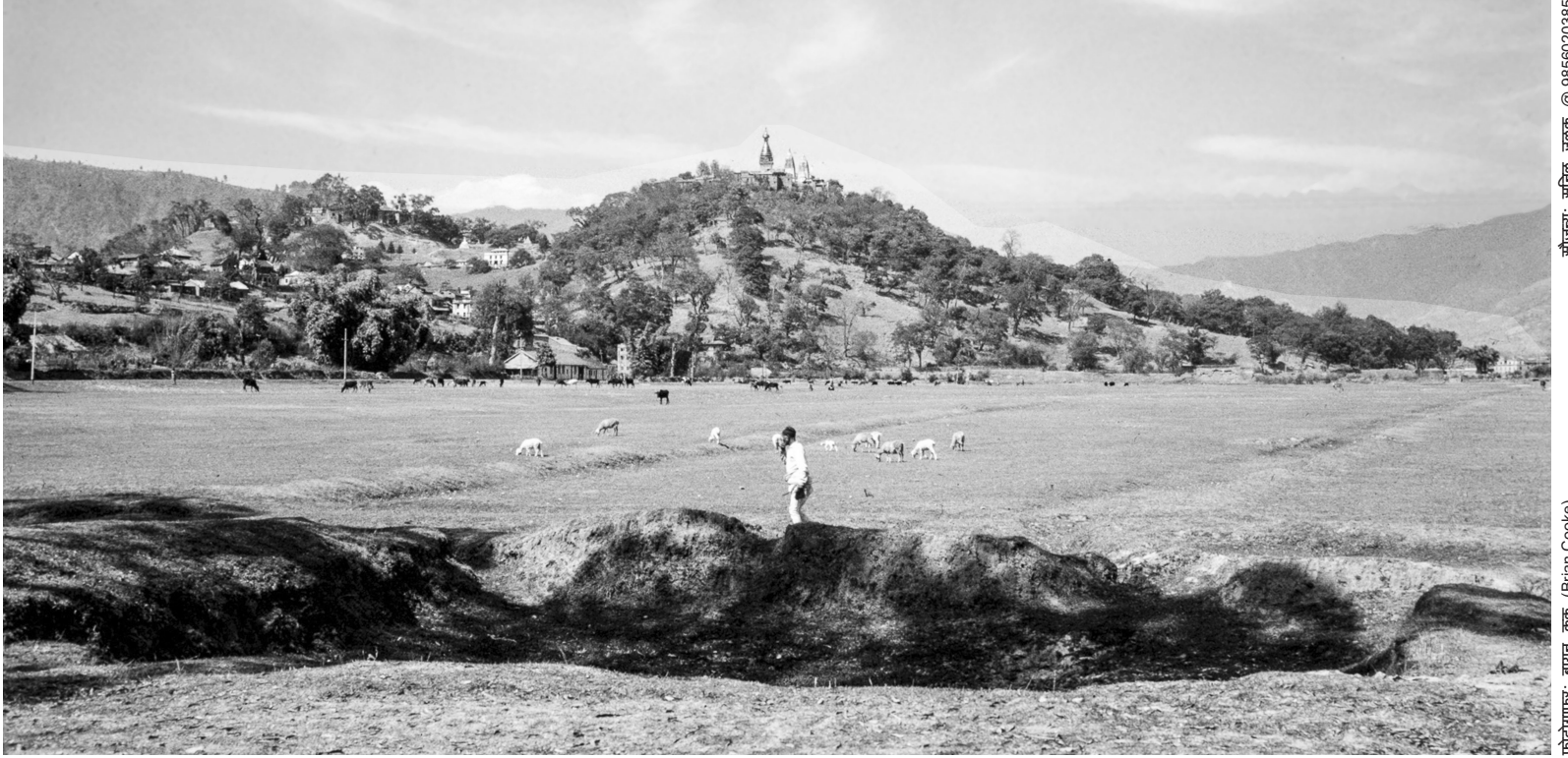
वि.सं. २०२२ सालको भदौ महिनामा छाउनी क्षेत्रको फाँटबाट नियाल्दा देखिएको स्वयम्भूनाथको मनमोहक दृश्य ।